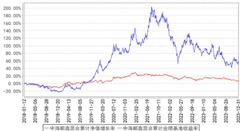
中海顺鑫混合累计净值增长率与同期业绩比较基准收益率的历史走势对比图